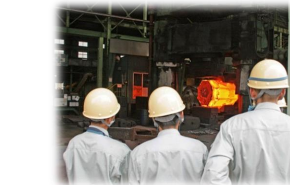
↑鍛造工場見学の様子