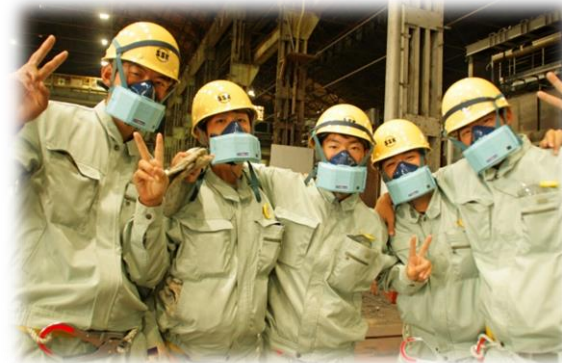
↑機械工場見学の様子