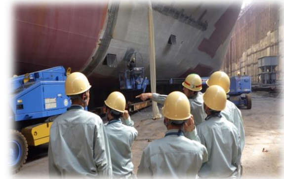
←建造ドック見学の様子