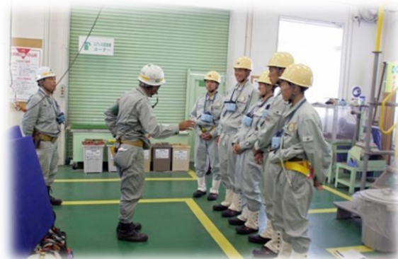
↑安全体感研修の様子