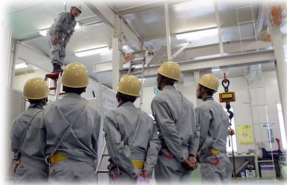
↑安全体感研修の様子

生徒さんたちの感想では「タンカーに乗って船のいろんな仕組みを知ったことが一番印象に残った体験になった」、「会社で働く光景を見ることができてとても良い経験になった」、「あと少しで社会に出る身として、今回学んだことを忘れず、今後の学校生活に活かしていきたい」など、率直な意見を頂きました。